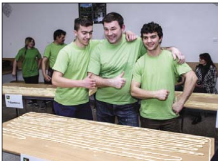
● Vikartovce III. s hotovým šúľancom.

Za pol hodiny z kila múky, pol kila zemiakov, dvoch vajec a vody ušúľali najdlhší šúľanec členovia družstva športového klubu Horec. Ich šúľanec s dĺžkou 40,7 m sa stal zároveň najdlhším šúľancom v histórii súťaže. Do súťaže sa zapojilo 10 trojčlenných skupín zo Spišského Bystrého, Kravian, tri družstvá z Vikartoviec, domáci športový klub Horec, Dobrovoľný hasičský zbor, miestny odbor Matice slovenskej, miestne Poľnohospodárske družstvo a súťažiaci z partnerskej obce Kazár z Maďarska.