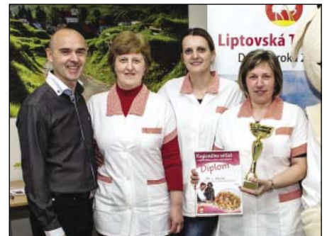
● Víťazky v jedení šúľancov.