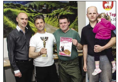
● 1. miesto vo výrobe šúľancov.